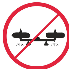
Drony / Drones