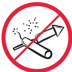
Materiały pirotechniczne / pyrotechnics