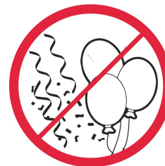
Balony, serpentyny, konfetti / Balloons, streamers, confetti