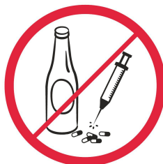
Napoje alkoholowe, narkotyki, substancje pobudzające, psychotropowe / alcohol drinks, drugs, stimulants or psychotropic substances