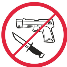
Broń, materiały wybuchowe, noże - przedmioty, których można użyć jako broń / weapons, explosives, knives, anything that could be adapted for use as a weapon