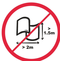
Banery lub flagi o wymiarach większych niż 2.0 m x 1.5 m. / flag size max. 2.0 m x 1.5 m