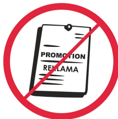
Przedmioty, materiały komercyjne i promocyjne / promotional or commercial objects or materials