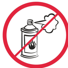
Gaz w aerozolu, substancje żrące, łatwopalne, barwniki / aerosol sprays, corrosive, flammable materials, colorants