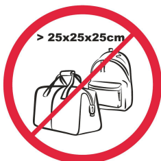
Pudła, torby, plecaki, walizki i inne wszelkie przedmioty większe niż 25x25x25 cm / items larger than 25x25x25 cm