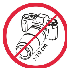
Profesjonalne aparaty fotograficzne, kamery wideo / professional photo cameras, video cameras