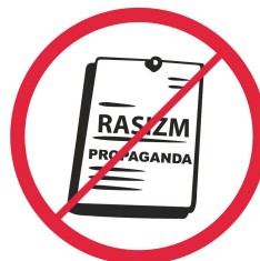
Materiały rasistowskie, ksenofobiczne, polityczne, religijne, propagandowe, prowokacyjne / political, religious, propaganda, provocative materials etc.