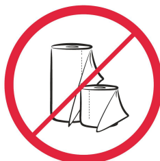
Rolki papieru, duże ilości papieru / paper rolls, large quantities of paper