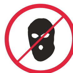
Kominiarki / balaclavas