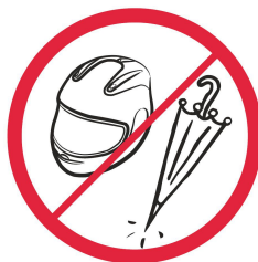
Kaski, parasolki z ostrym zakończeniem / helmets, umbrellas with sharp points