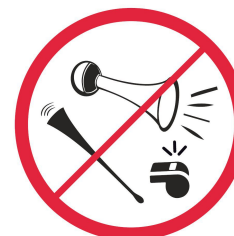
Wuwuzele, trąbki, urządzenia emitujące dźwięk / vuvuzelas, trumpets, devices emitting a sound