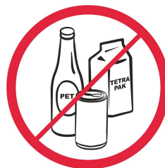
Butelki, puszki, kubki, dzbanki, opakowania PET, szklane / bottles, cups, jugs, cans, objects made from PET, glass