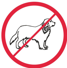
Zwierzęta / animals