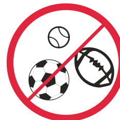
Piłki sportowe, plażowe, inne / Balls